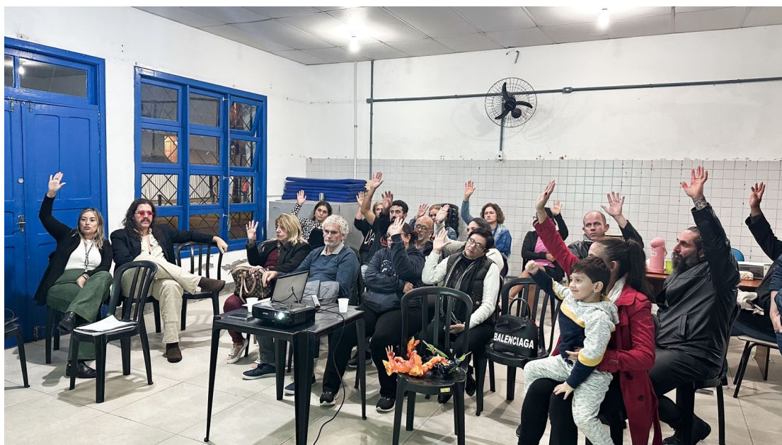
04) Momento da Votação de alteração das propostas.