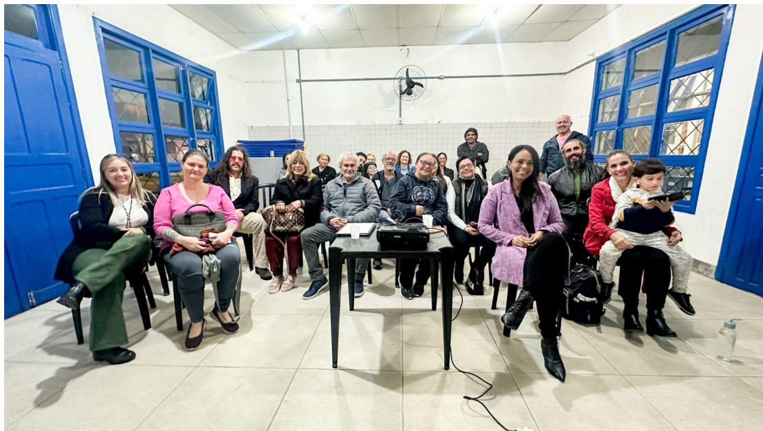
01) Registro dos presentes na Audiência Pública.

Fotos da Audiência Pública, da Lei Aldir Blanc, realizada no dia 15 de maio de 2024, no Espaço Cultural Nelson Santos em Itapema/SC.